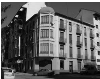
Edificio singular de la Avenida Jacetania

Dejar sin efecto la solicitud de modificación del PGOU, conservando el catalogo de bienes protegidos con sus fichas actuales.